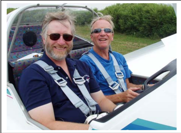
Flyging i Vejles "Mofa" (motorfalke)