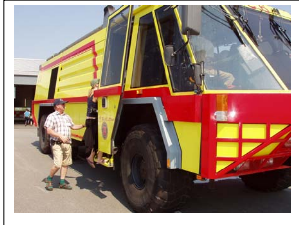
Utflukt til Billund hvor vi fikk prøvekjøre brannbil type STOR.