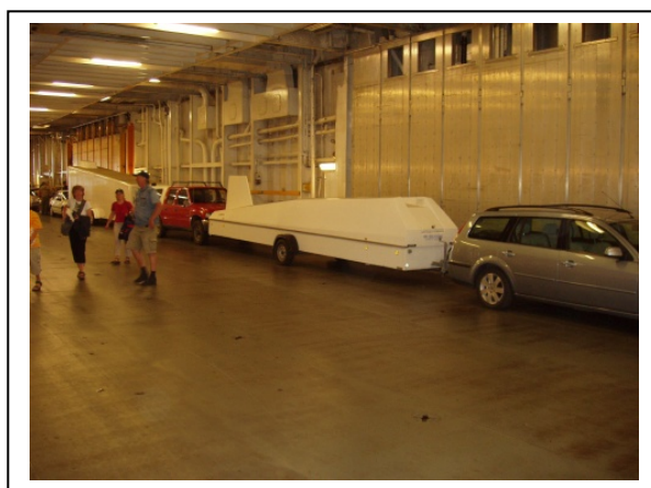
To seilfly på slep fyller godt opp på bildekket.