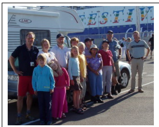
Avreise med Color Festival fra Oslo

Allerede en uke etter årets aktivitetsuke reiste mange av klubbens medlemmer til vår vennskapsklubb i Vejle hvor vi tilbrakte en flott uke. Her var alt tilrettelagt for at hele familien skulle trives. Frokost, lunsj og middag ble servert og til kvelds var det mulighet for ymse former tørsteslukkere i teltet. Klubben hadde med GEL og GBY. Været var varmt! Over 30 grader enkelte dager, men vi hadde likevel brukbar termikk og fikk fløyet en god del. Danskene tilbød både vinsjstart og flyslep med Rotax Falke. Men så godt som Vejle Svæveflyveklub har lært oss opp, var det ingen som trengte flyslep. Banen på Hammer er nå utvidet til drøyt 1000 meter. Bortsett fra at bruddstykket forbruket nok lå litt i overkant av snittet, forløp uken problemfritt. Her er noen situasjonsbilder fra uken.