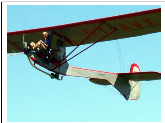
Svein på vei opp i 2G