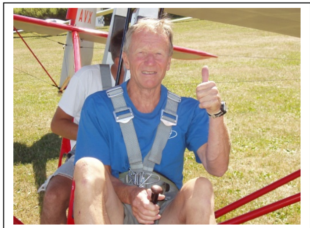
Blek, men fattet før turen med denne farkosten - 2G.