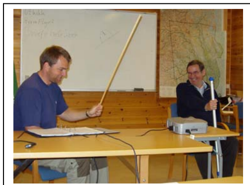
Flyging med kosteskraft på i-kurs. En populær og lærerik aktivitet i regnværet.